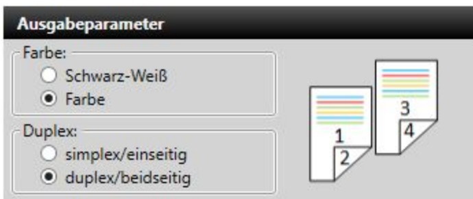
Abb.: Einstellungen in der easyNova Software für doppelseitigen Versand