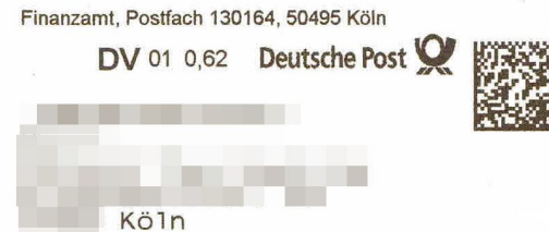
Abb.: DataMatrix-Code, statt Briefmarke

DV-Freimachung steht für “ D aten- V erarbeitungs-Freimachung”. Das bedeutet, dass statt des manuellen Aufklebens einer Briefmarke eine Art QR-Code in das Adressfenster gedruckt wird: