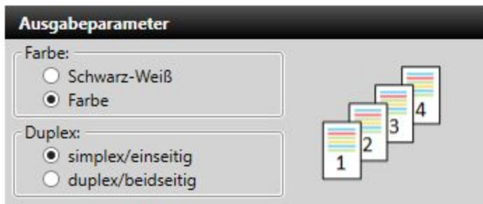
Abb.: Einstellungen in der easyNova Software für einseitigen Versand

Wenn Sie Ihre Briefe mit easyNova versenden, haben Sie die komfortable Einstellung, Briefe automatisch im Duplex-Druck versenden zu lassen: